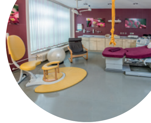
Beide Kreißsäle bieten flexible und individuelle Gebärpositionen.

Während der Geburt werden Sie durch eine fachkompetente Hebamme und einen erfahrenen Frauenarzt begleitet. Im Falle einer operativen Entbindung oder Besonderheiten im Geburtsverlauf stehen die ebenfalls rund um die Uhr im Haus tätigen Kinderärzte und Anästhesisten sofort zur Verfügung.