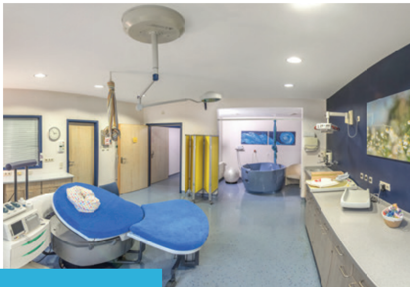
Dieser Kreißsaal bietet die Möglichkeit in einer Gebärwanne zu entbinden.

Ihre Wünsche, Bedürfnisse und Vorstellungen stehen im Mittelpunkt. Sie bestimmen Ihre Gebärhaltung selbst, sofern keine medizinischen Gegebenheiten dagegen sprechen. Ihnen stehen eine komfortable Entbindungswanne, moderne Gebärhocker und multifunktionale Entbindungsbetten (sog. Gebärlandschaft) zur Verfügung. Mit