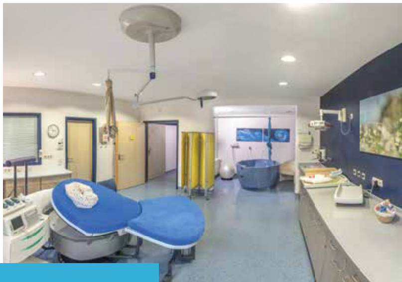
Dieser Kreißsaal bietet die Möglichkeit in einer Gebärwanne zu entbinden.

Ihre Wünsche, Bedürfnisse und Vorstellungen stehen im Mittelpunkt. Sie bestimmen Ihre Gebärhaltung selbst, sofern keine medizinischen Gegebenheiten dagegen sprechen. Ihnen stehen eine komfortable Entbindungswanne, moderne Gebärhocker und multifunktionale Entbindungsbetten (sog.